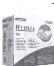
8355 - WYPALL* X50 Utěrky - POP-UP krabice / bílé

Značkové výrobky Kimberly-Clark Professional* se vyrábějí výhradně podle schválených specifikací. Naší zásadou je navrhovat, vyrábět a dodávat výrobky, které splňují naše specifikace pro jakost, funkčnost a bezpečnost.