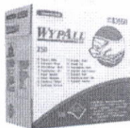
8355 - WYPALL* X50 Cloths - Pop-up box / White

Kimberly-Clark Professional* branded products are only manufactured to authorized specifications. It is our policy to design, manufacture and deliver products which meet our specifications for quality, performance and safety.