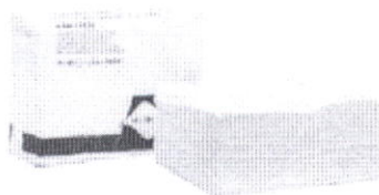
7506 - KIMTECH* Savé utěrky - Z sklad / bílé

děkujeme Vám za poptávku týkající se následujících výrobků Kimberly-Clark Professional*.